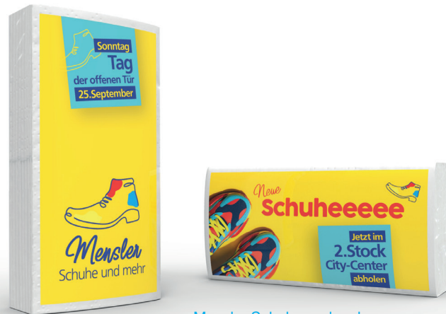
Mensler Schuhe und mehr MAXI-Taschentücher