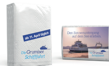
Die Grumisee Schifffahrt MINI-Taschentücher

Die in dieser pdf dargestellten Motive, inklusive der Firmen-, Orts- und Namensbezeichnungen sind frei erfunden. Etwaige Ähnlichkeiten mit tatsächlichen Firmen, Orten oder Personen wären rein zufällig.