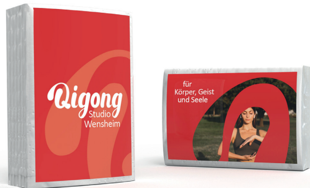
Qigong - Studio Wensheim MINI-Taschentücher